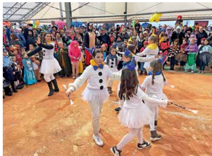
Pustno rajanje v Žireh