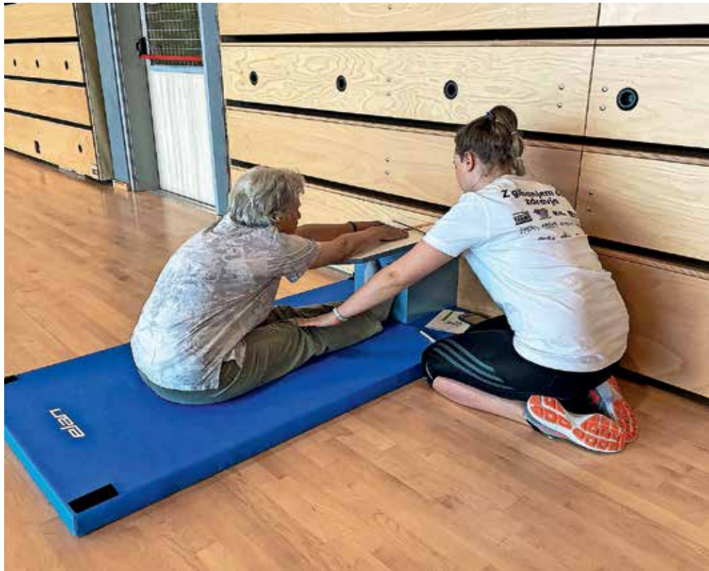
Lanski ŽIRfit je razgibal skoraj sto Žirovcev.

Svoj telesni fitness pa bodo udeleženci 18. maja lahko preverili na ŽIRfitu! Na tradicionalnem športno-družabnem dogodku bodo s sklopom meritev tudi letos merili telesni fitness posameznikov, ki vključuje preverjanje zmogljivosti srčno-dihalnega sistema, ravnotežja, moči telesa, koordinacije gibanja in gibljivosti. Po zaključku meritev, ki so prilagojene različnim zmogljivostim in starostim, sledi kratka analiza z nasveti o tem, kaj lahko posameznik sam stori za izboljšanje zdravja in dobrega počutja. Udeležbo na Žirfitu priporočajo starejšim od 18 let, tudi tistim, ki so se ga v preteklosti že udeležili in bi radi videli