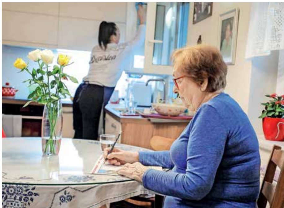
V občini Žiri so sprejeli Strategijo starosti prijazne občine Žiri (fotografija je simbolična).

Občina Žiri namenja pozornost področju kakovostnega staranja že vrsto let; da se ta prizadevanja ne bi končala, se je na pobudo Lokalne akcijske skupine odločila, da pristopi k izdelavi Strategije starosti prijazne občine Žiri. Priprava strategije je smiselna zaradi splošnih demografskih trendov po svetu in v Sloveniji – prebivalstvo se stara, v naslednjih letih pa se bo število starejših še skokovito povečalo. Po izkušnjah programa Starosti prijaznih mest in občin (v nadaljevanju SPMO) se lokalna okolja najbolje odzivajo na izzive, ki jih prinaša demografska kriza. Z izdelavo strategije se zagotovi sistematičen in hkrati konkreten proces, ki pomaga lokalnim skupnostim postajati bolj in bolj starosti prijazne. V strategiji občina oceni, kaj mora in zmore storiti, da bo staranju in starosti bolj prijazna. Na podlagi te ocene si začrta strateške usmeritve in konkretne korake, ki jim v naslednjih letih sledi. V procesu priprave