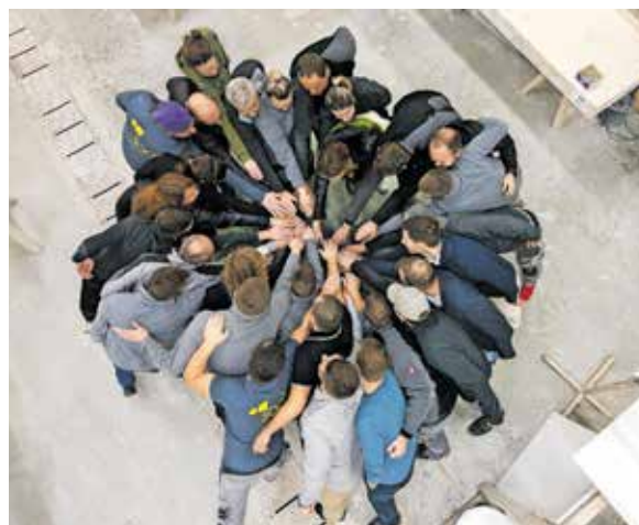
MARMOR HOTAVLJE, D.O.O., HOTAVLJE 40, GORENJA VAS, WWW.MARMOR-HOTAVLJE.SI