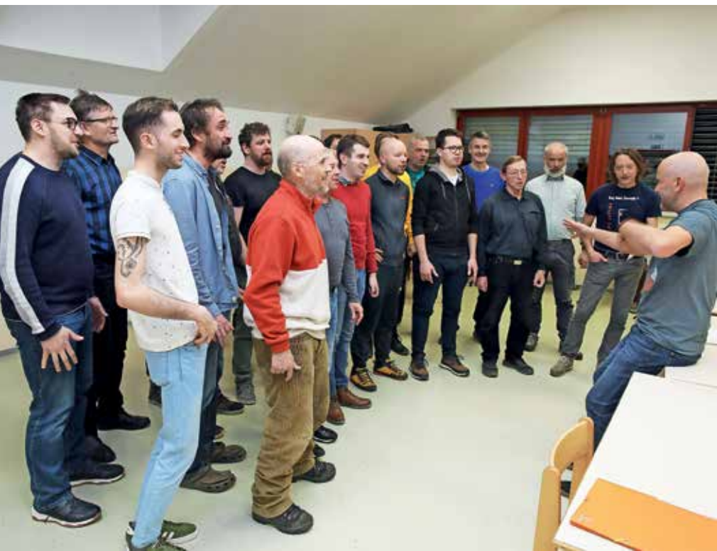
Moški pevski zbor Alpina praznuje šestdeset let ustvarjanja.