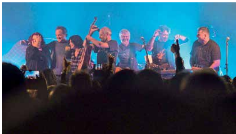
Lokalna scena 2023

Glasbeno društvo Frekvenca je preteklo leto zaključilo uspešno, za kar se zahvaljujejo vsem obiskovalcem, nastopajočim, Občini Žiri, sponzorjem in vsem sodelujočim pri organizaciji. V leto 2024