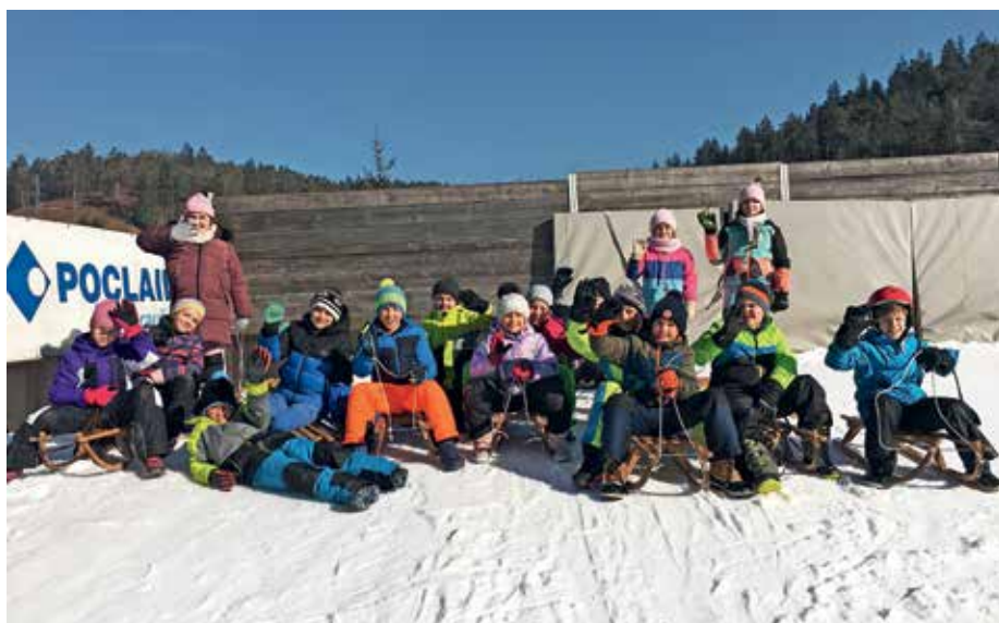
Športni dan 4. razreda Osnovne šole Žiri v NC Poclain