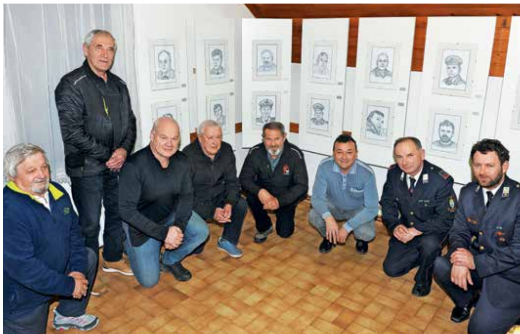
Nekdanji predsedniki PGD Račeva pred Galerijo predsednikov

Sicer pa so račevski gasilci na tokratnem občnem zboru podrobneje pregledali tudi opravljeno delo in projekte, ki jih čakajo letos. »Preteklo leto je zaznamovalo zares veliko število intervencij,