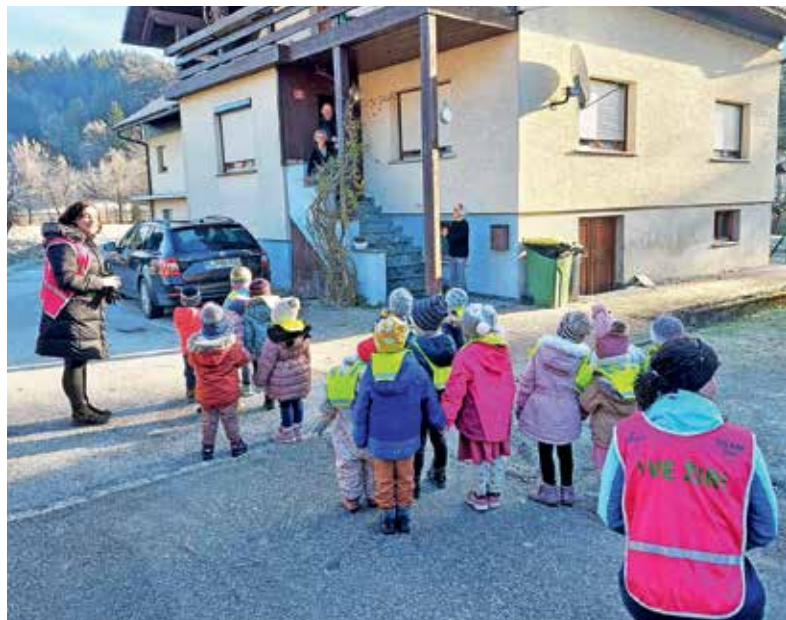
S prazničnim obiskom in pesmijo so tudi letos razveselili starejše.