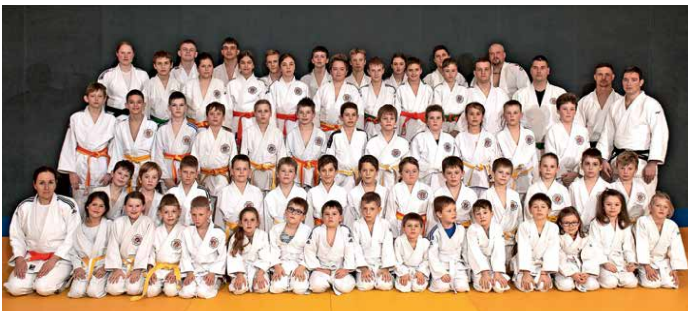
Judo klub Žiri

Dne 25. maja pa nas čaka še en zanimiv dogodek, saj smo dobili kandidaturu za državno prvenstvo ml. članov in članic (U23) in st. dečkov in deklic (U14). Državno prvenstvo smo v Žireh gostili že v letu 2022, vendar bo letos to za nas prav poseben dogodek, saj imamo v klubu zelo veliko sekcijo starejših dečkov in deklic U14. Veselimo se vseh, ki boste glasno podprli domače tekmovalce s tribun.