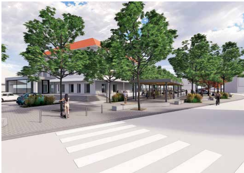
Projekcija ureditve središča Žirov